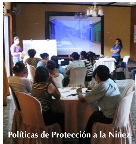
Políticas de Protección a la Niñez

Estas actividades fueron de mucho provecho en donde se llego a la reflexión nos pusimos en los zapatos de los niños y las niñas nos regresamos en el tiempo a revivir nuestras experiencia y vivencias de la que ayer fue nuestra niñez en la aula de clase y en nuestra vida Familiar frente a este nuevo redescubrimiento de aprendizaje comprendimos de la importancia de los momentos educativa de la niñez lo que representan los momentos gratos y no gratos para el día de hoy como adultos recordar con cariño nuestra niñez y producto de esta niñez es como actuamos y pensamos resultado de todo lo vivido.