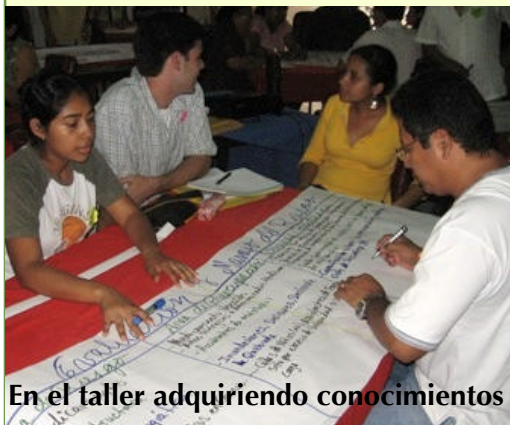
En el taller adquiriendo conocimientos