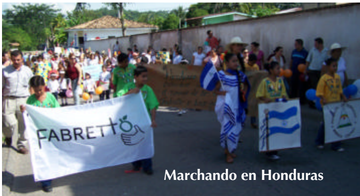
Marchando en Honduras