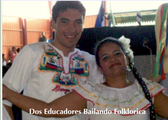
Dos Educadores Bailando Folklorica