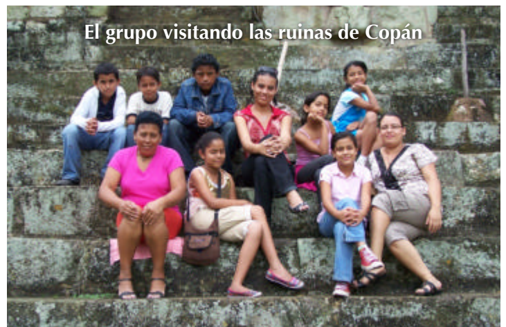
El grupo visitando las ruinas de Copán